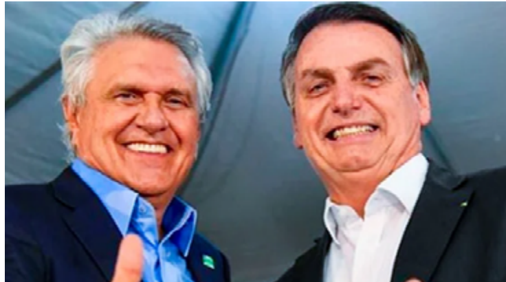
Ronaldo Caiado e Jair Bolsonaro: juntos no Rio de Janeiro