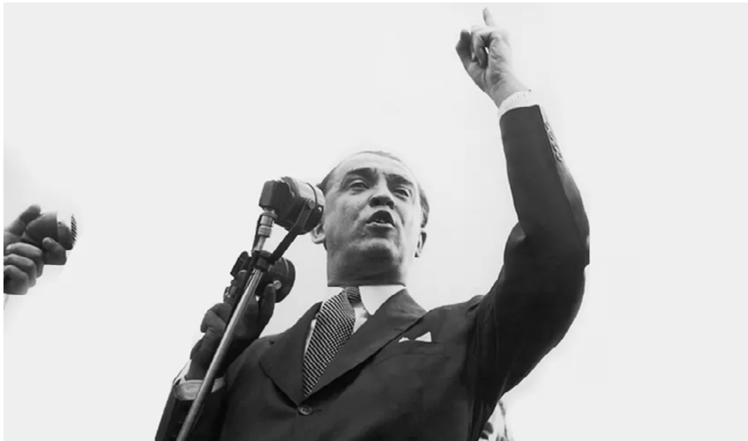
JK exerceu a presidência sob o lema de evoluir 50 anos em cinco, com plano de metas que modernizou o capitalismo brasileiro