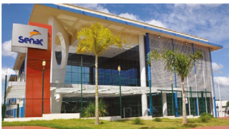
Matrículas serão via processo seletivo; 90 vagas, opções comerciais e gratuitas

Serão disponibilizadas 90 vagas, com opções tanto comerciais quanto gratuitas, permitindo acesso inclusivo à área de estudo. O curso terá como base conteúdos de tecnologia provenientes de grandes multinacionais como Microsoft, Nvidia, Google Cloud, Amazon Web Services e Red