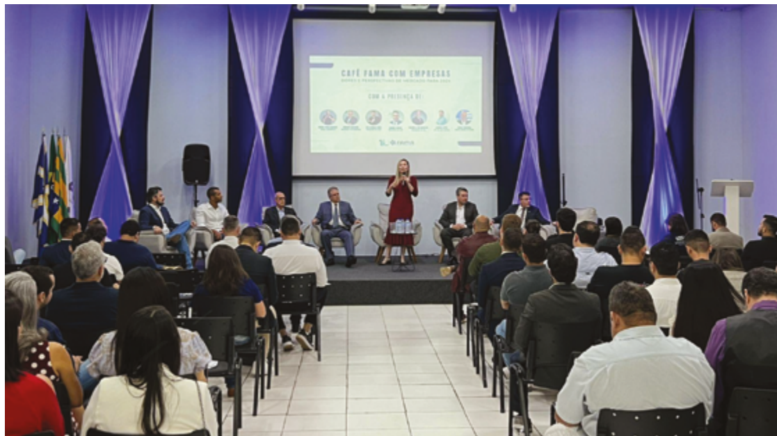
Debate reuniu, no auditório da faculdade, pequenas, médias e grandes empresas, além de entidades do setor

Sob a coordenação da equipe organizadora da Fama, a mesa redonda teve as presenças do presidente da Associação Comercial e Industrial de