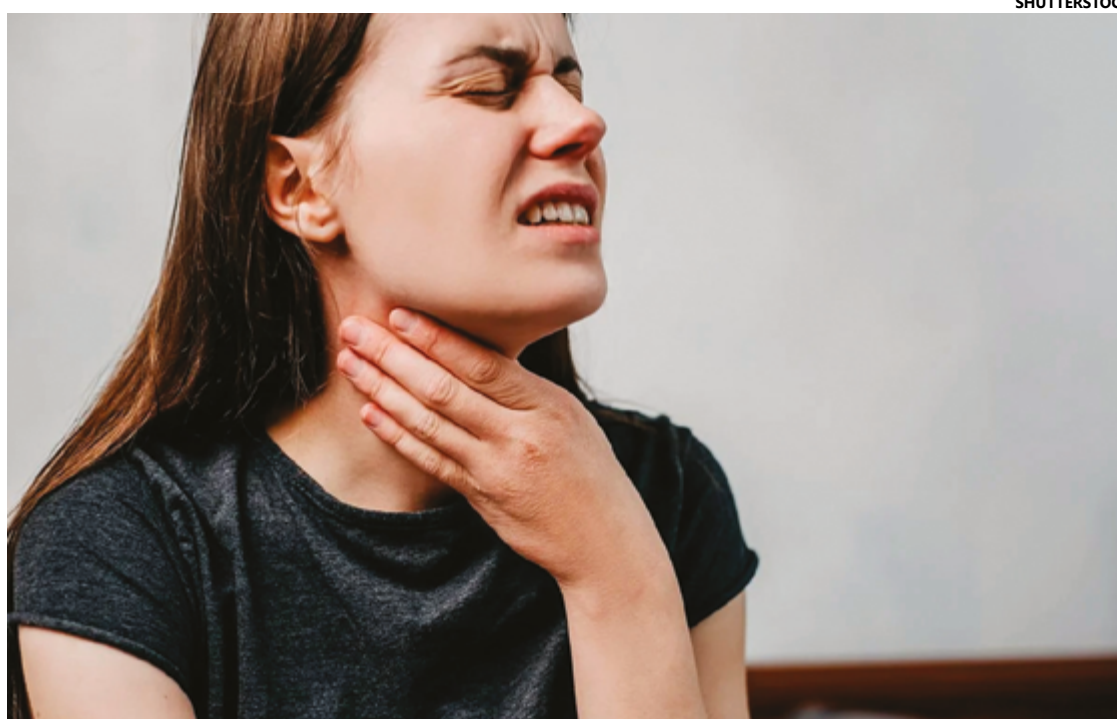
Segundo especialista, até mesmo a roupa utilizada ao fazer um maior esforço vocal pode interferir na saúde