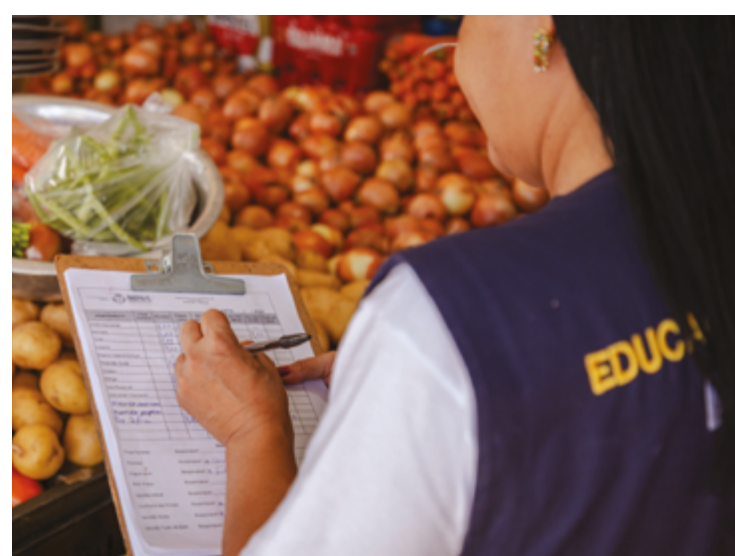
Na comparação entre supermercados visitados, a maior variação foi do cará

O Procon também ressalta a importância da participação da população no combate às condutas ilícitas contra o consumidor. A denúncia ou qualquer prática suspeita pode ser registrada pelo telefone (62)3902-1365 ou WhatsApp (62)3902-2882. Confira o relatório completo no https://www.anapolis.go.gov.br/pesquisas-procon/ .