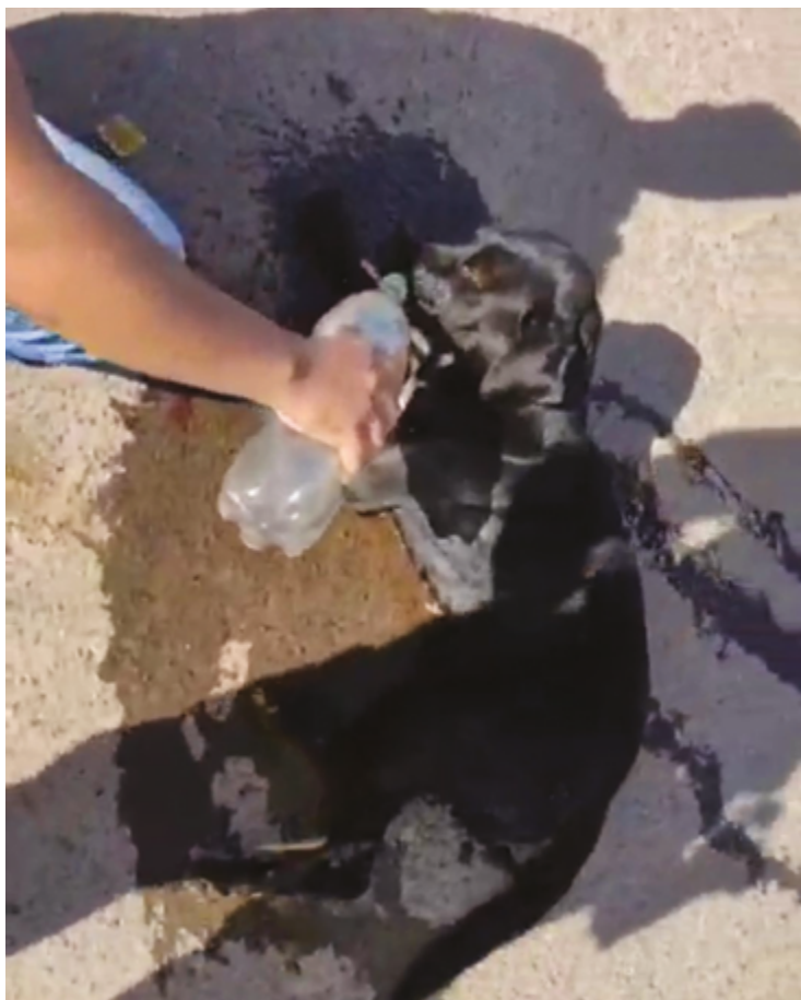
Parlamentar diz que são frequentes denúncias de recusa da empresa em receber cães encontrados soltos na pista e levados à concessionária

“Cabe à concessionária a preservação e fiscalização da via, para garantir a segurança do tráfego de veículos, cuidando da iluminação, manutenção e sinalização. Por isso o pagamento do pedágio, que está estipulado no artigo 27 da Constituição Federal. Se o usuário decidir utilizar a rodovia, ele está sujeito ao pagamento para usufruir diretamente dos serviços prestados pela con-